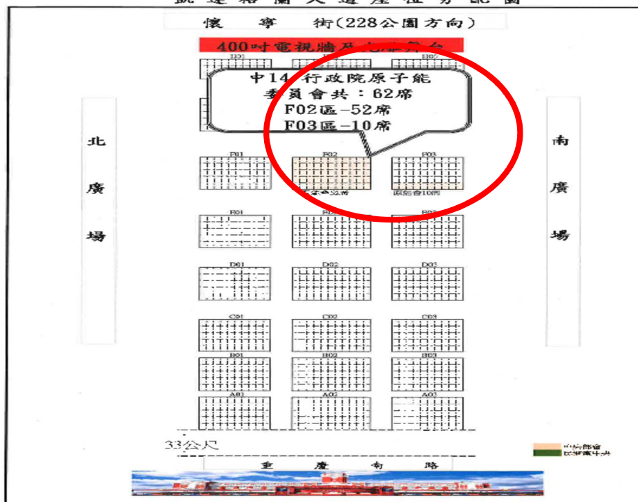
凱達格蘭大道座位分配圖