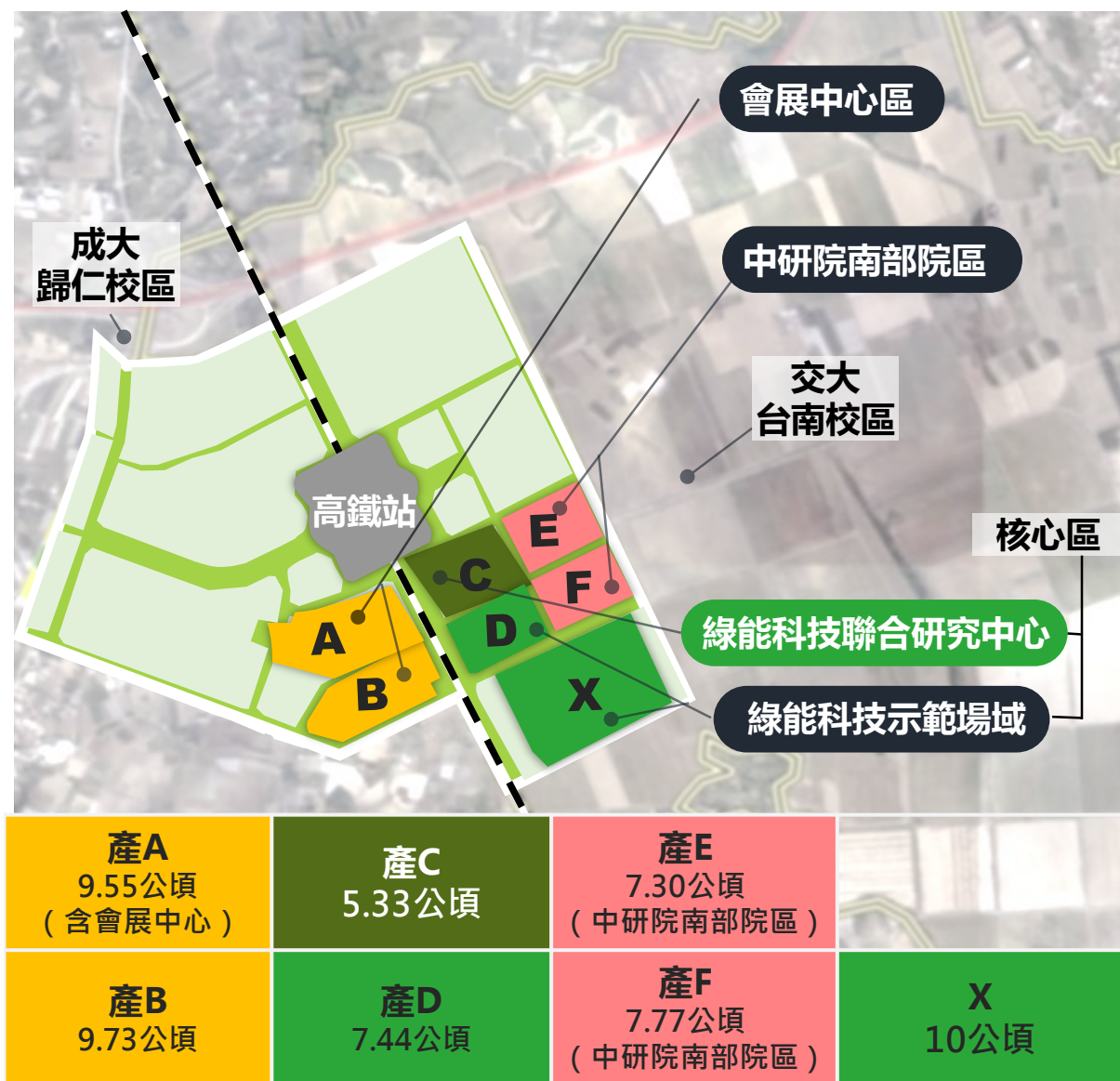
沙崙綠能科學城範圍