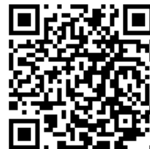
人事總處 行政法人專區 QR-code

https://www.dgpa.gov.tw/mp/archive?uid=149&mid=148